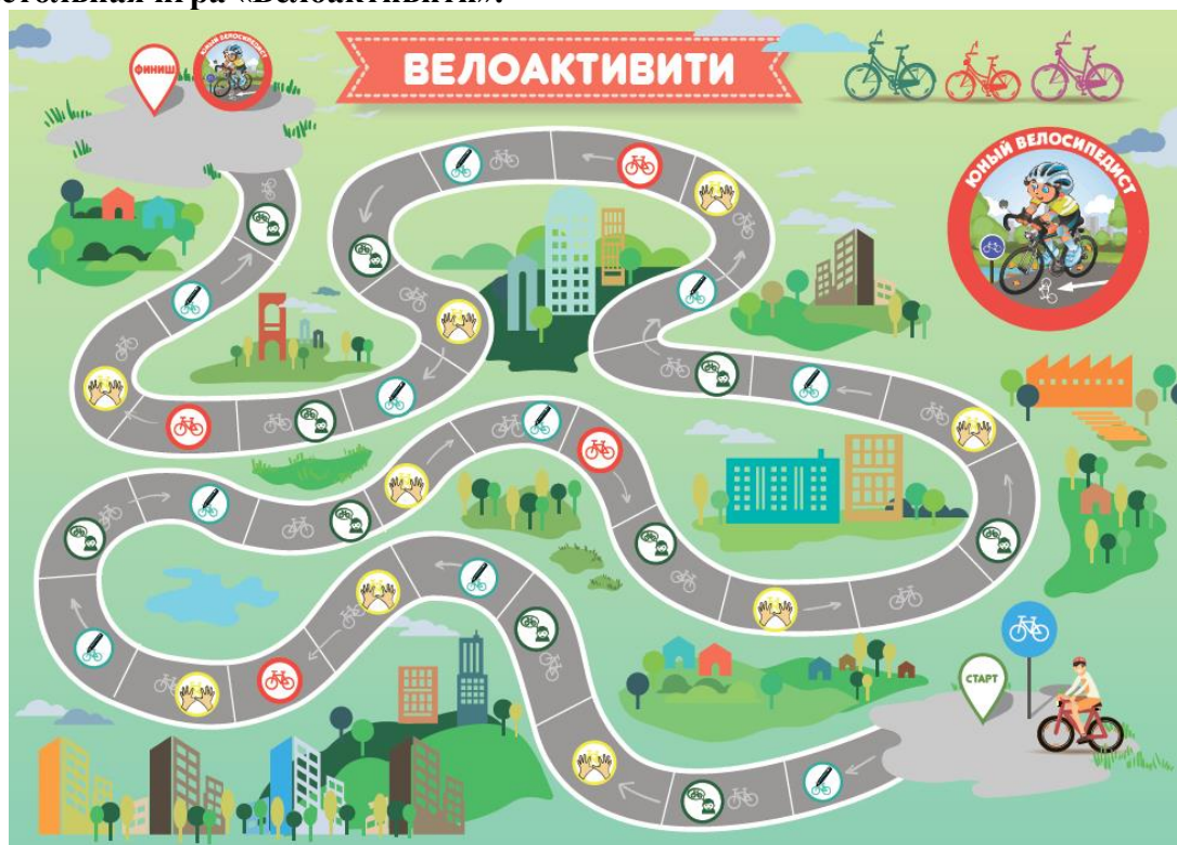
Карточки для игры.